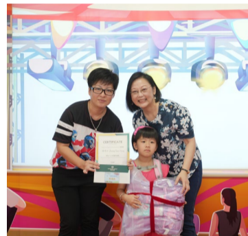
▲ 媽媽向女兒傾訴愛的心聲，場面溫馨感人。

「感恩有您」愛筵共聚讓居民與家人在溫馨的氛圍中共進美食，共享天倫之樂，留下難忘的回憶；家庭體驗活動區則讓居民透過寫信、親子按摩、手作等方式，向家人傳遞愛意，增進家庭關係。我們也期待未來有更多能夠體現愛與感恩的活動，讓同心村繼續發揮關愛互助小社區的精神。