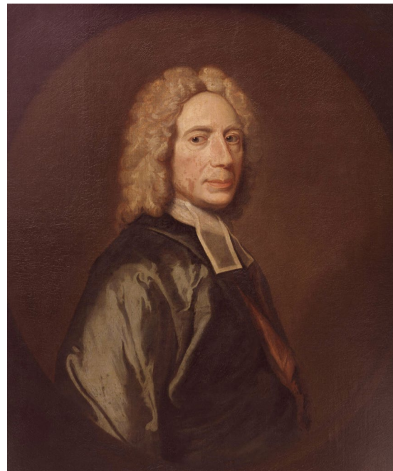
▲ 以撒·華特 (Isaac Watts 1674-1748)

「上帝是人千古保障，是人將來希望」 「普世歡騰！救主下降：大地接她君王」 「每逢思想奇妙十架，銘感救恩，虔誠敬禮」 「日月所照萬國萬方，耶穌必為統治君王」