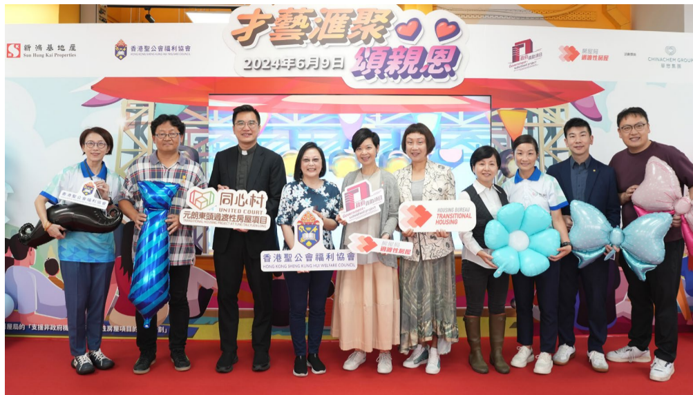
▲ 參與演出的居民與嘉賓們歡聚一堂，留下珍貴的合影。