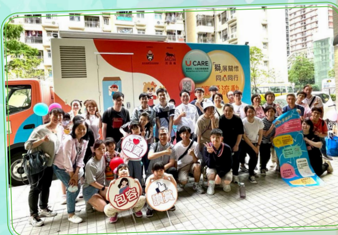
▲2022年5月7日 UCARE「家」多一點愛社區關懷活動