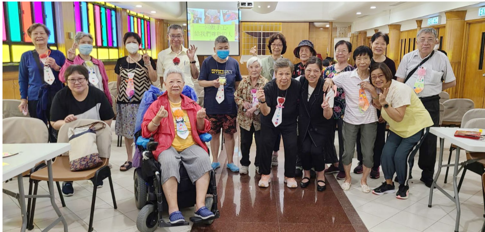
▲ 社區關懷活動「長幼童樂」慶祝父親節

聖提摩太堂雖然是一所規模較小的禮拜堂，但受託牧養範圍甚廣，覆蓋薄扶林、置富、華富、華貴、田灣、香港仔、石排灣、黃竹坑及鴨洲等地區。該堂與區內三所聖公會學校緊密合作推動學校福傳和牧養工作，分別為：聖公會呂明才中學、聖公會置富始南小學、聖公會田灣始南小學及與西南聯區合力承擔聖保羅書院小學及中西區聖士提反女子中學及聖士提反女子中學附屬小學的學校福音工作，希望藉着與學校的聯繫能接觸家長和學生。此外，本堂也與區內幾間長者院舍有緊密合作，包括位於華富邨的香港基督教服務處華康宿舍、位於鴨洲洲利東邨的香港基