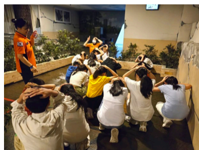
▲ 參觀首爾市民安全體驗館