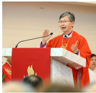
▲ 陳詠明大主教講道

今日我們在這裏聚集，是為着在過去 85 年上主給予這個群體的導引獻上感恩，亦為未來的日子同心禱告，求主繼續帶領大家，更好的在元朗這個社區廣傳福音，服侍坊眾。