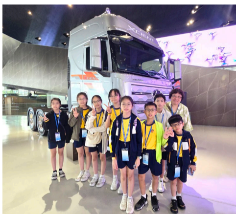
▲ 參觀了現代汽車展示館

首站，師生們參觀了現代汽車展示館，深入了解現代汽車的製造技術及其在電動車、自動駕駛等前沿技術上的最新發展。通過模擬駕駛情境的互動裝置，同學們感受到未來汽車駕駛體驗的無限可能。隨後，參觀了Kia 360開放式空間，欣賞韓國汽車品牌在造車工藝、設計美學及品牌形象塑造方面的用心。此外，還參與了韓國文化體驗，包括傳統食品製作及韓服穿戴，感受到韓國悠久的文化底蘊。