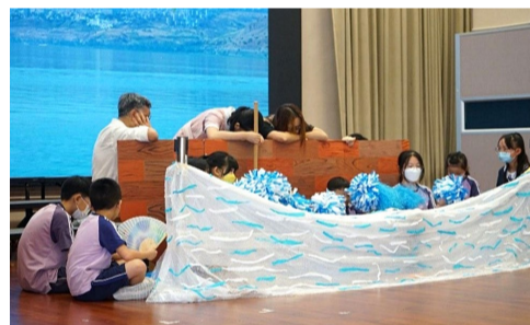
▲ 聖公會置富始南福音聚會

聖提摩太堂在天父的帶領下，在南區開展不同群體的牧養關懷工作，就像芥菜種一樣不斷生長，竭力拓展上帝的國。未來將會重點推動青少年學生福音工作、家長及兒童事工，以及計劃成立長者學苑等。正如使徒保羅所說：「我栽種了，亞波羅澆灌了，惟有上帝使它生長。可見，栽種的算不了甚麼，澆灌的也算不了甚麼；惟有上帝能使它生長。」（林前 3:6-7）求主悅納眾弟兄姊妹手上所作的工，榮耀上主的聖名。