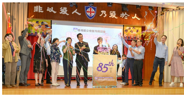
▲ 茶会上有別開生面的蛋糕亮燈儀式