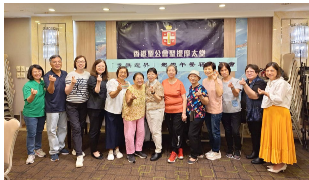
▲ 教友一起服侍長者@愛無邊界懇親午餐福音聚會