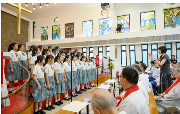
▲ 白約翰會督中學合唱團獻詩