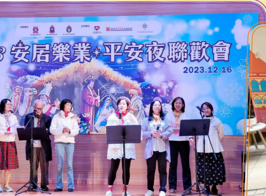
▲2023年12月16日 安居樂業平安夜聯歡會