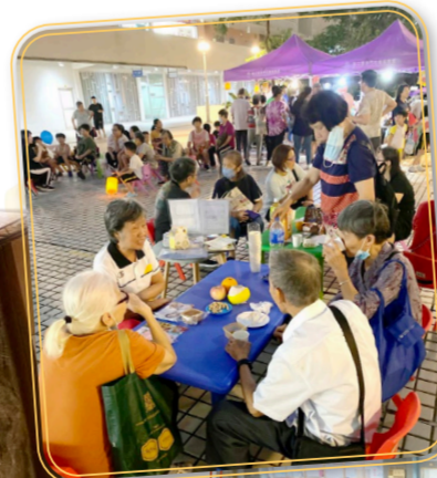
◀2023年9月28日 UCARE同樂慶中秋